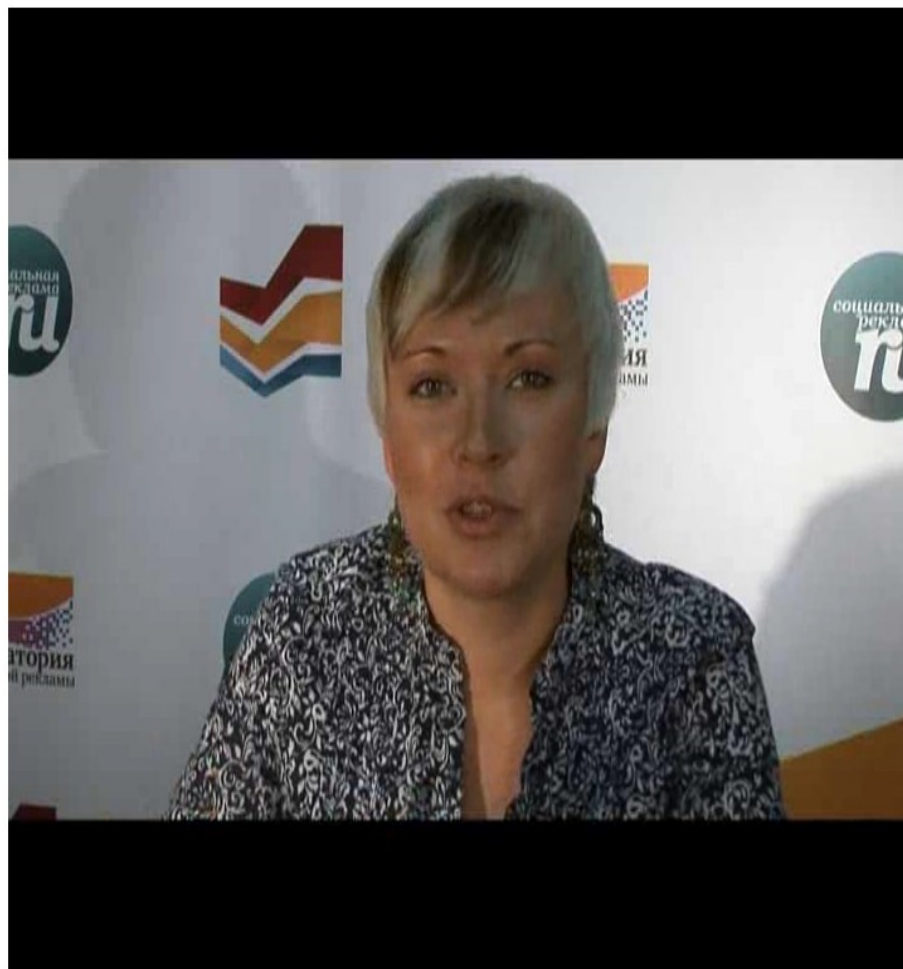
Видеолекция. Часть 1.